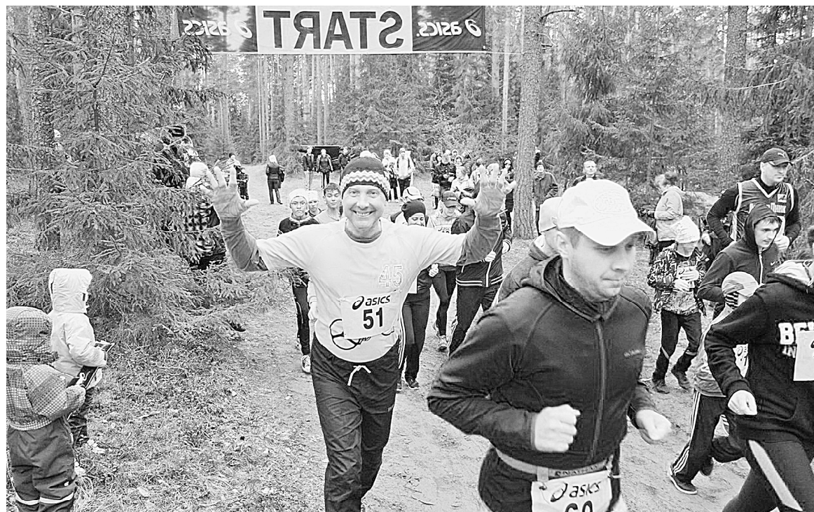
Полумарафон «Грунтовые дороги» собирает любителей бега со всей страны