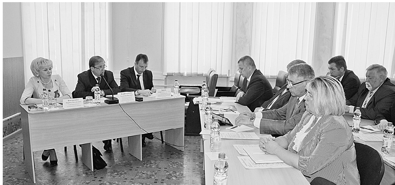
Участники областного семинара в зале заседаний администрации Боровичского муниципального района